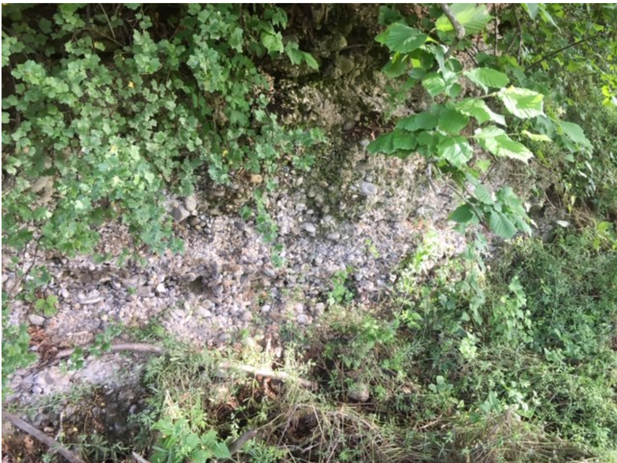
Abb. 14.5. Ein Aufschluss oberhalb Strick bei Oberottikon

Wir machen einen Kaffeehalt im Restaurant Strick in Oberottikon, bevor wir den Heimweg über Hundsruggen Bönler und Allenberg zurück zum Ausgangspunkt im Schöneich-Quartier antreten.