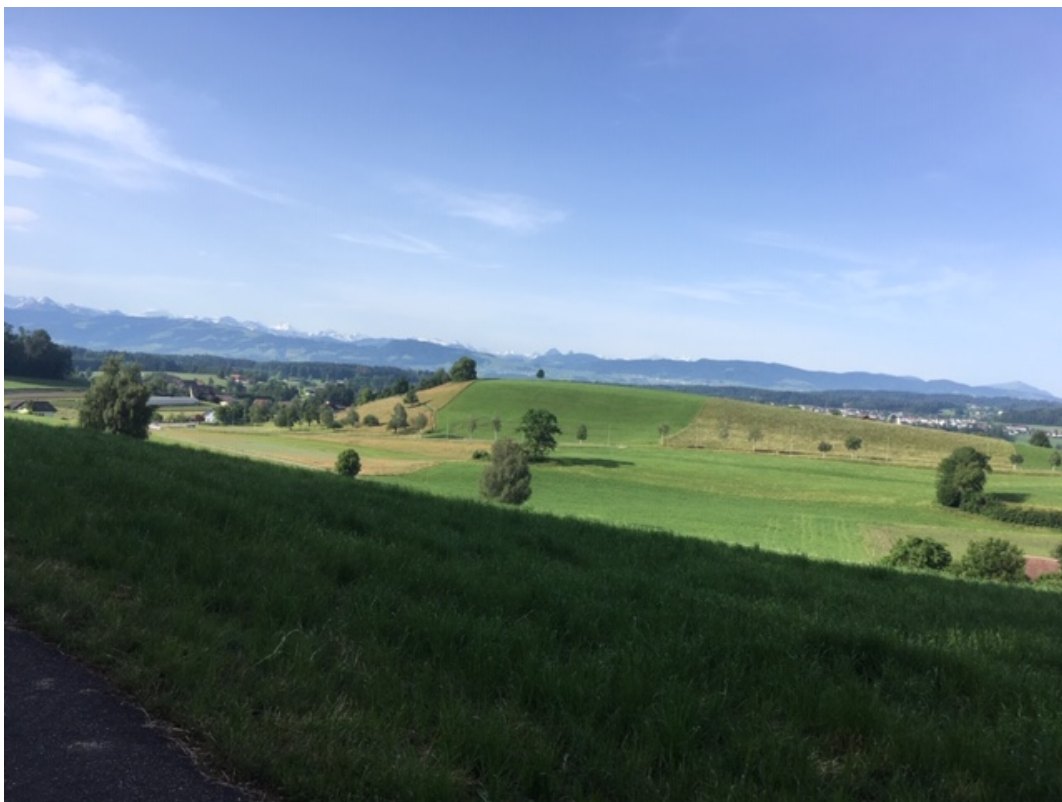
Abb. 14.4. Der Ottiker Bühl mit der klassischen Form eines Drumlins