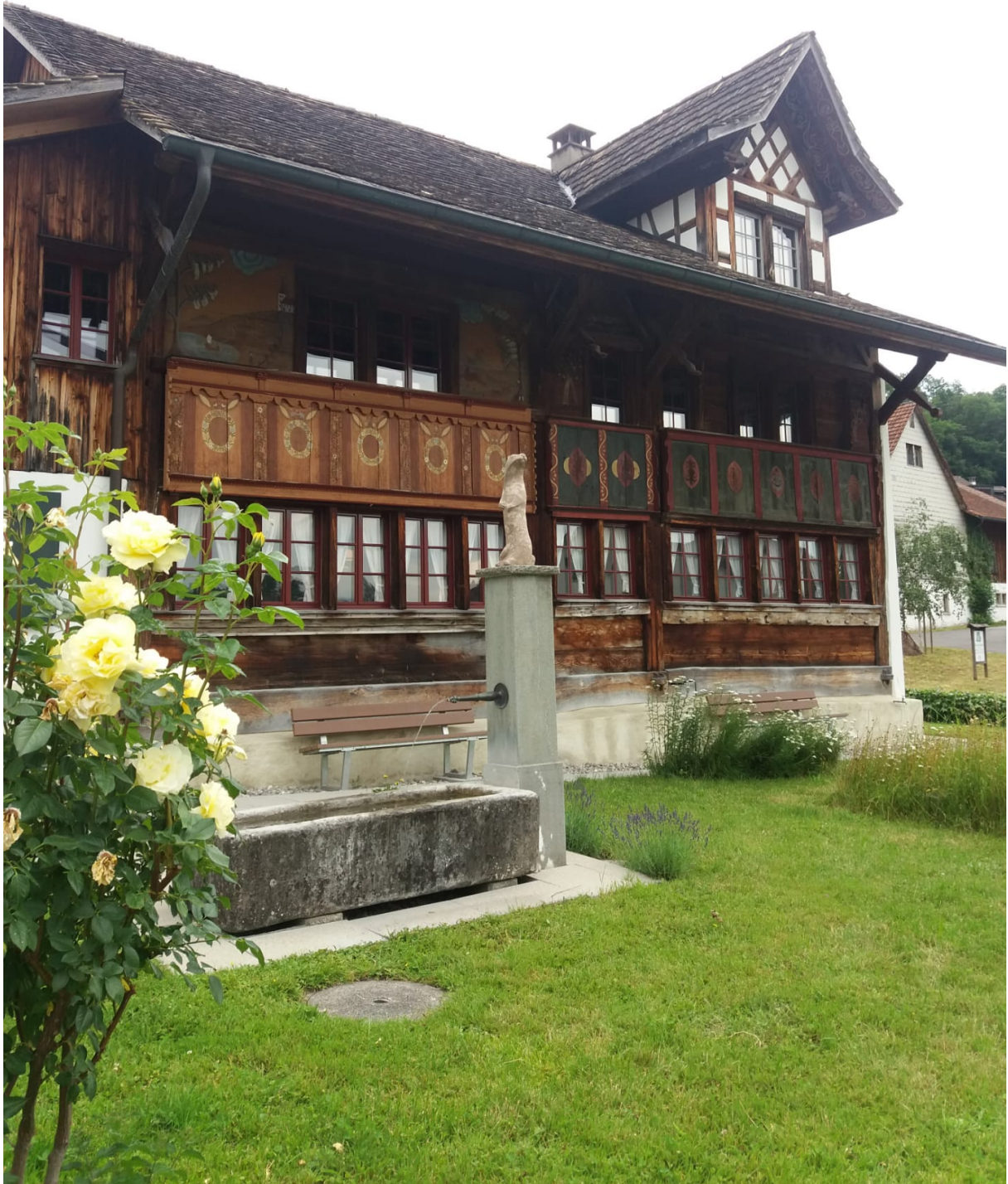
Abb. 14.7. Das Dürstelerhaus in Unterottikon ( https://www.duerstelerhaus.ch/ )

Das Dürstelerhaus in Unterottikon ist eines der schönsten in der Gemeinde Gossau. Es wurde 1660 an der Stelle eines 1592 schriftlich erwähnten Vorgängerbaues errichtet. Auf der östlichen Stirnfront weist es ein hübsches Riegelwerk auf. Die