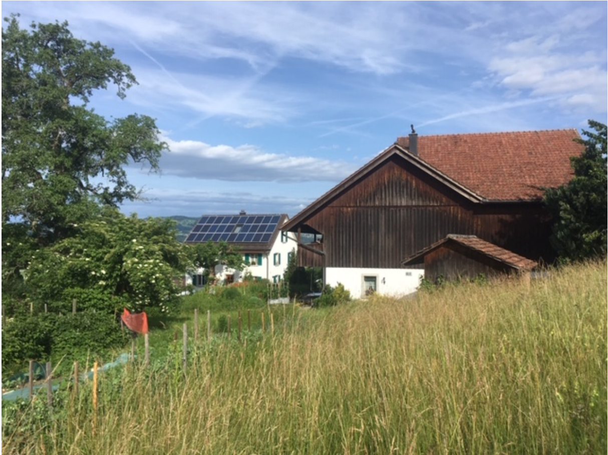
Abb. 14.6. Das Wiberg-Haus erinnert an den Schriftsteller Albin Zollinger (1895-1941), der hier prägende Jugenderlebnisse hatte