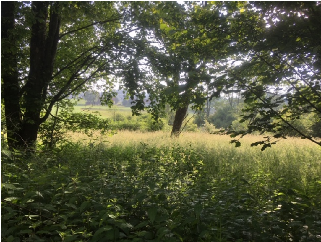
Abb. 14.1. Das Isertried mit dem Isertweiher. Der Untergrund besteht aus Grundmoränenlehm, der einst von der Ziegelei in der Islen bei Ottikon abgebaut worden ist.

Der Jahrhunderte alte Hof von Allenwinden ist ein dreiteiliges Riegelhaus, das die ganze Ebene des Isertriedes beherrscht. Auf dem Hügel nördlich davon soll früher ein Hof namens „Tempel“ gestanden haben. Möglicherweise befand sich dort zu Urzeiten eine heidnische Opferstätte (nach Orientierungstafel beim Hof Allenwinden)