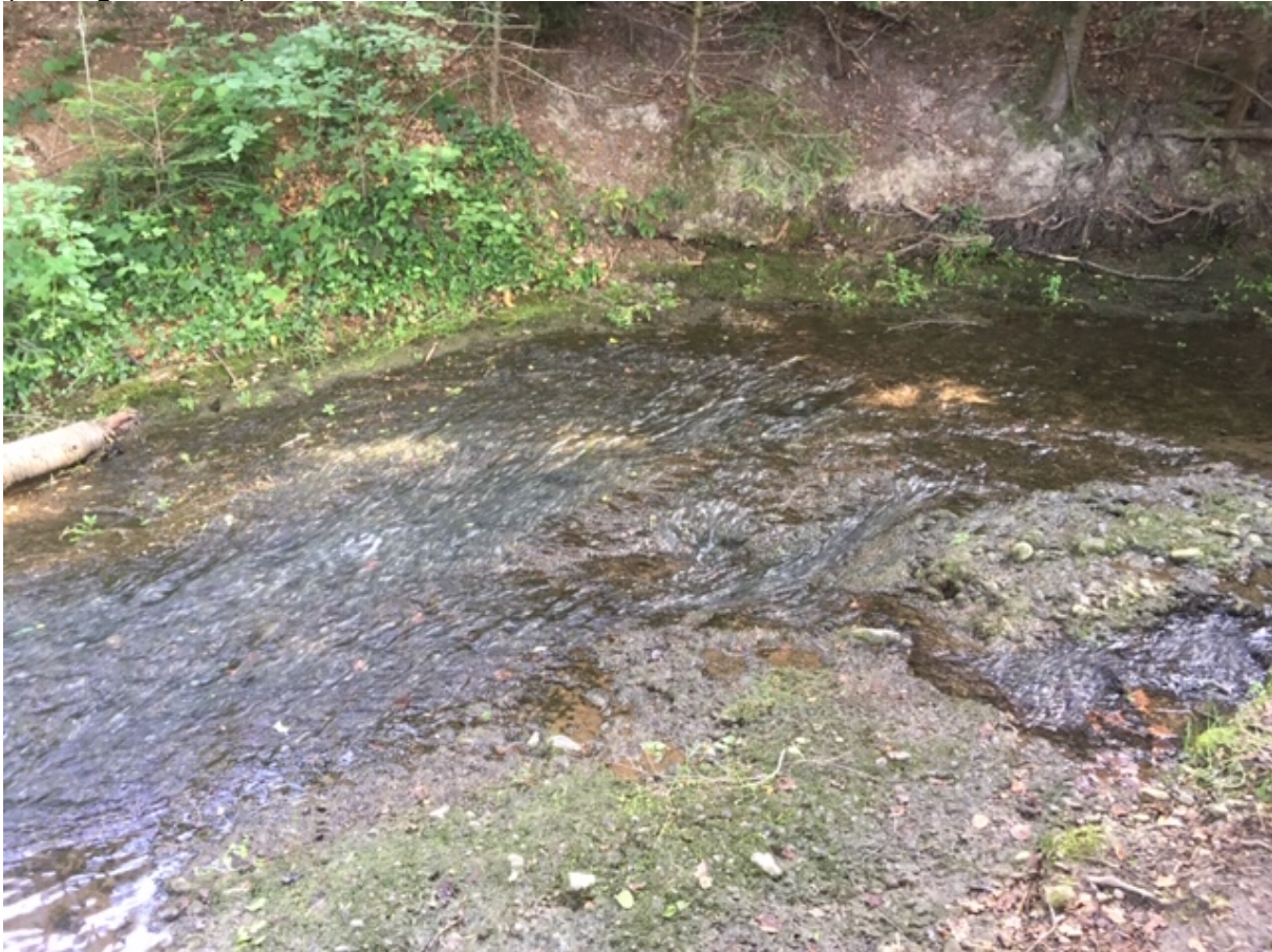
Abb. 14.2. Der Oberlauf des Gossauerbaches durchfließt eine Art Canon. Stellenweise wird die Molasse sichtbar.

Noch im 19. Jahrhundert war der Gossauer Dorfbach ein wichtiger Energielieferant. Ein ausgeklügeltes System von Wasserkraftanlagen – Stauweihern, Schwellen, Druckleitungen, Wasserrädern und Turbinen – versorgte insgesamt sieben konzessionierte Betriebe mit Energie. Der Gossauer Dorfbach war also sozusagen ein kleiner Bruder des berühmten „Millionenbaches“ zwischen Uster und Wetzikon (Zollinger, 1978)